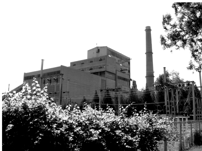
Термоелектрана „МОРАВА“ у Свилајнцу

ТЕ Морава је стационирана на ободу електроенергетског система шумадијске петље и својим производним капацитетом од 120MW(мегавата) и разводним постројењем 110кВ(киловолтног)напонског нивоа представља сигуран и важан фактор стабилности ЕПС-а.