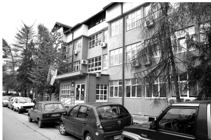
Зграда Суда у Деспотовцу

У Србији ће од 1. јануара 2014. бити 66 основних судова, уместо постојећа 34, као и 58 тужилаштава, утврђено је Законом о седиштима и подручјима судова и тужилаштава.