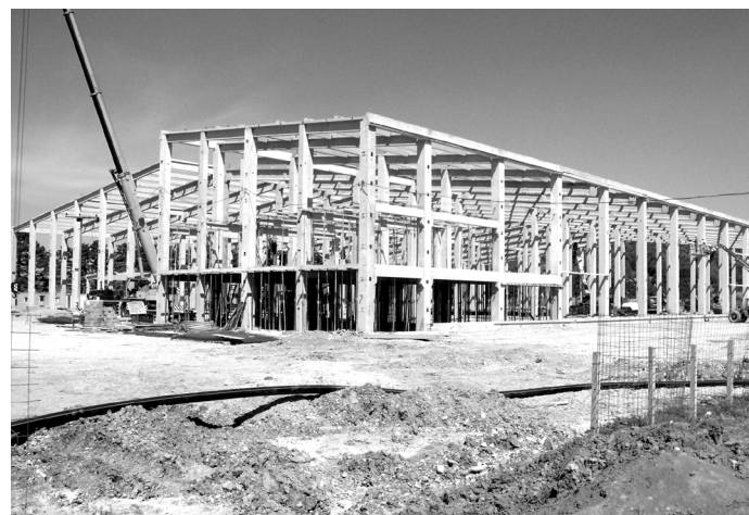
Градња хале „Реум“

Свилајнац има индустријску зону на уласку из правца Велике Мораве, потпуно инфраструктурно опремљену укључујући и железницу. Општина Свилајнац је током 2008. године почела изградњу нове у пољу на изузетно плодној земљи на путу према Пожаревцу. Осим обимних земљаних радова на пољопривредном земљишту није било струје, воде, канализације, телефонских линија и много тога другог. Међутим, то све није било препрека да локална власт определи велика средства и отпочне градњу зоне и хале за Фирму „Реум“ из Немачке. Цео посао је најављиван као највећа инвестиција у Свилајнцу у последњих 20 година. Често су се од локалних, а и републичких званичника чуле изјаве „што је Фиат за Крагујевац то је Реум за Свилајнац“. Упућенији у цео пројекат израчунали су да ће се ту запослити око 500 радника. Била је то неко време и ударна вест у свим медијима у Србији. На задовољство свих почела је изградња, обука радника у Немачкој, радови у пољу на инфраструктури и новој хали. Цео посао је водила фирма из Свилајнца што је додатно давало наду у успех. Иако су радови повремено заустављани, због финансија и проблема у фирми „Реум“ нико није сумњао у коначан успех. У тренутку када су радови на изградње хале стали скептици су Индустријску зону „Велико поље“ назвали „Ђавоља варош“.