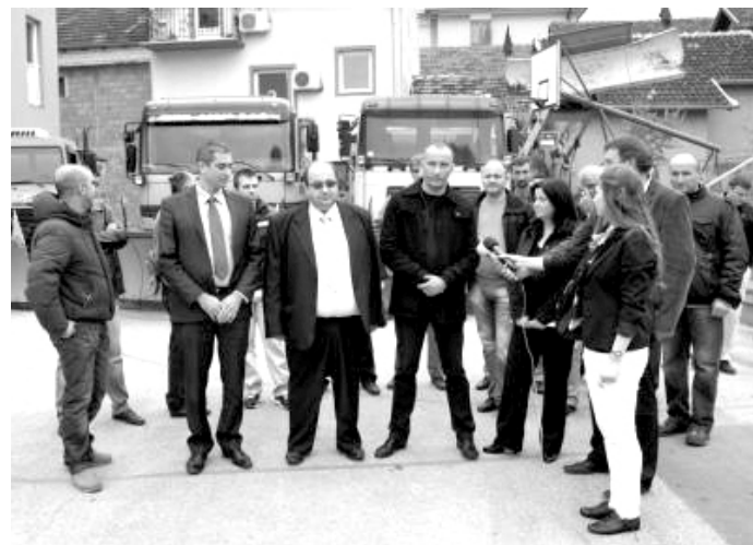
Детаљ са смотре