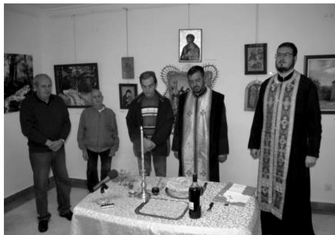
Сечење славског колача

У галерији Центра за културу “Свети Стефан, деспот српски” Удружење ликовних стваралаца „Манасија“ сечењем колача обележило је своју славу Св. Луку.