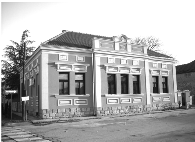
Реконструисана зграда библиотеке

Ресавска библиотека у Свилајнцу после обимних радова на реконструкцији свечано је отворена. Осим бројних званица отварању су присуствовали предстаници Министарства културе, Народне библиотеке Србије и локалне самоуправе. Радови су трајали неколико месеци и у комплетну поправку, крова, фасаде, прозора, столарије и кречења уложено је 12 милиона динара. Ресавска библиотека основана је пре 145 година и броји 60 хиљада наслова. У данашњи објекат, кућу Мите Исаковића, уселила се 1986, а 2001. године проглашена је за споменик културе. После реконструкције вредан књижни фонд биће на комфорнији и савременији начин доступан читаоцима.