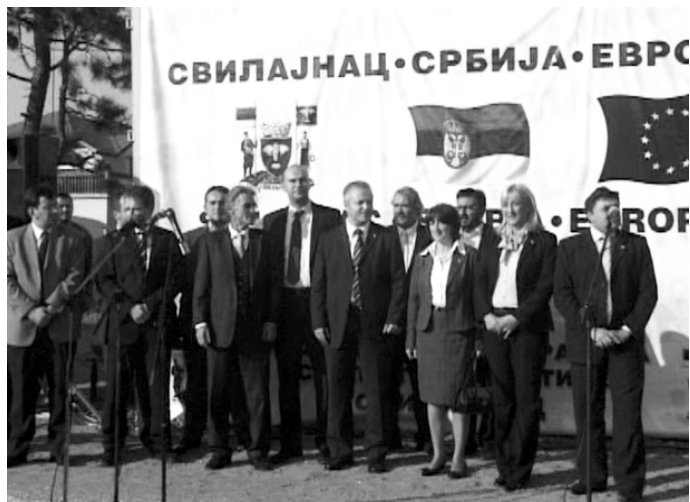
Свечани почетак радова на изградњи хале за „Реум“

Немачки партнер се обавезао да инвестира 10 милиона евра и запосли 300 радника.