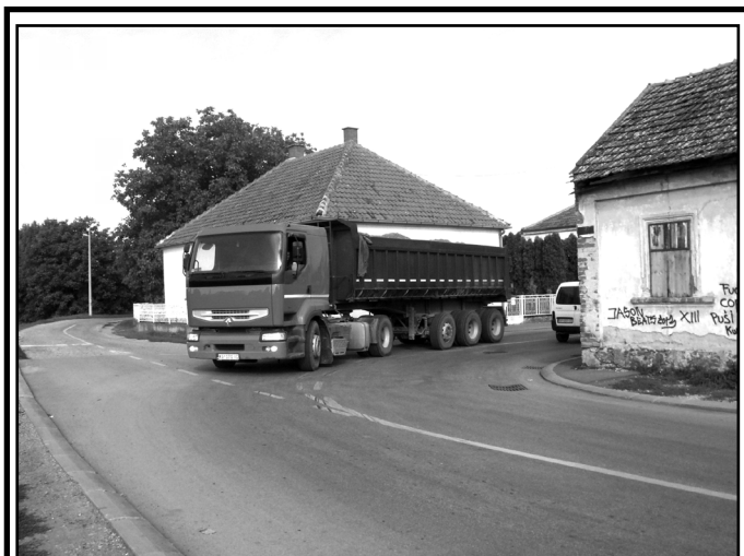
Опасна кривина у Свилајнцу - за бољу прегледност неопходно поставити огледало